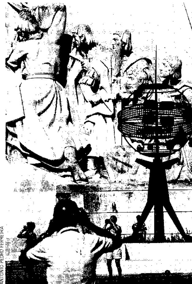
O ensino em turismo está a espalhar-se pelo país