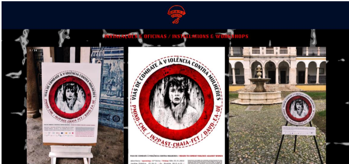
Figura 8 – Partilha de experiências da Câmara Municipal de Évora