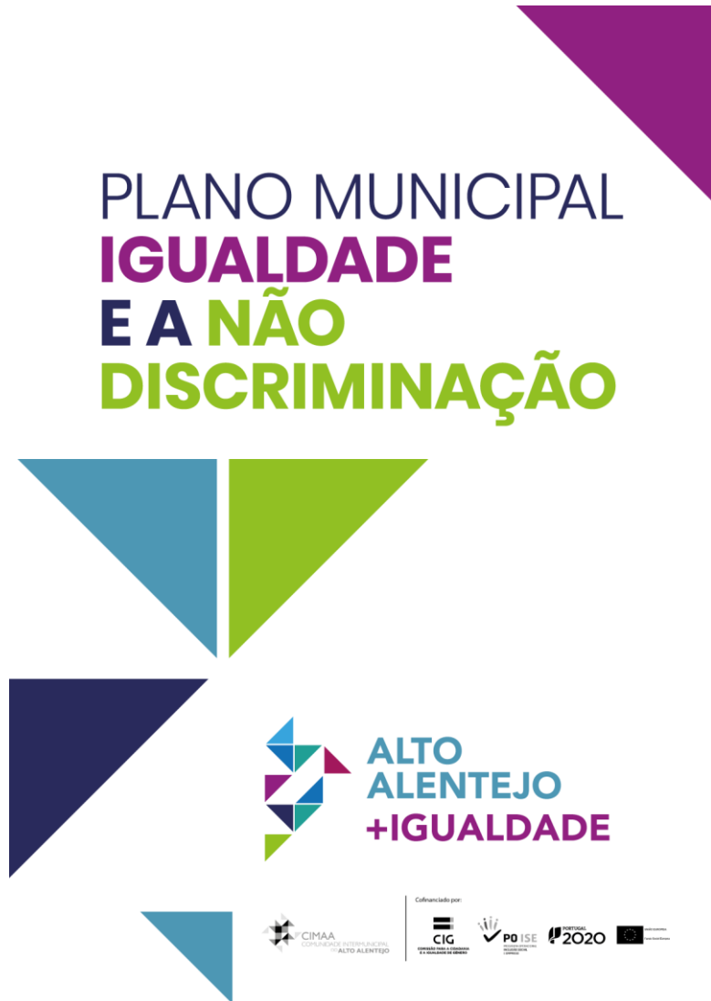
Figura 4 – Poster de divulgação do PMIND