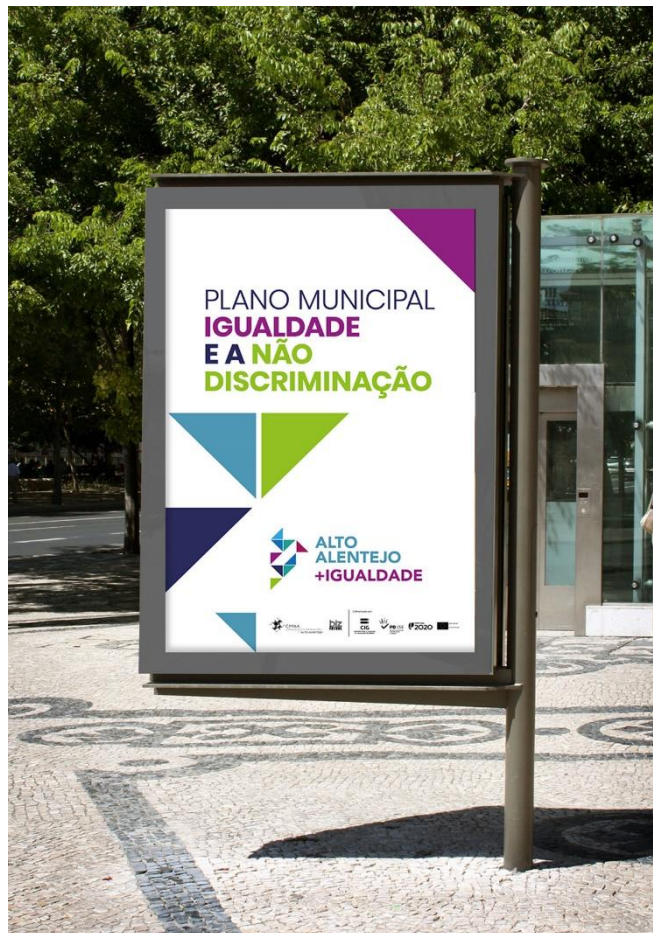
Figura 1 – Mupi de divulgação do PMIND