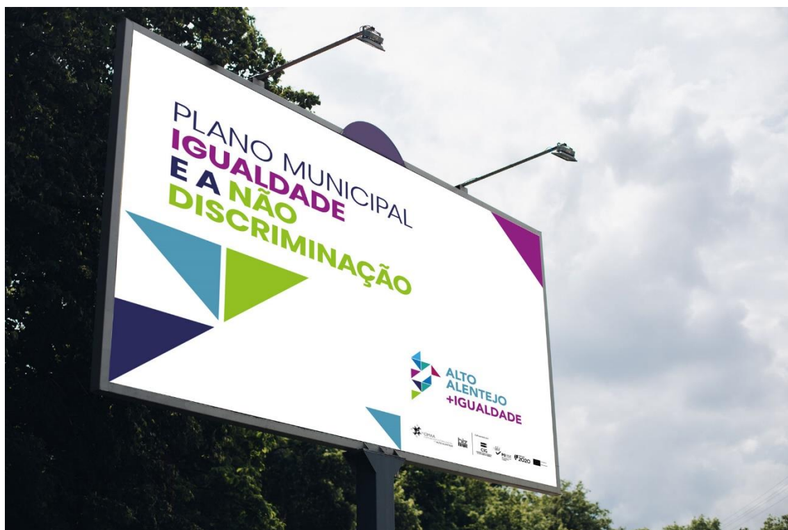
Figura 2 – Outdoor de divulgação do PMIND