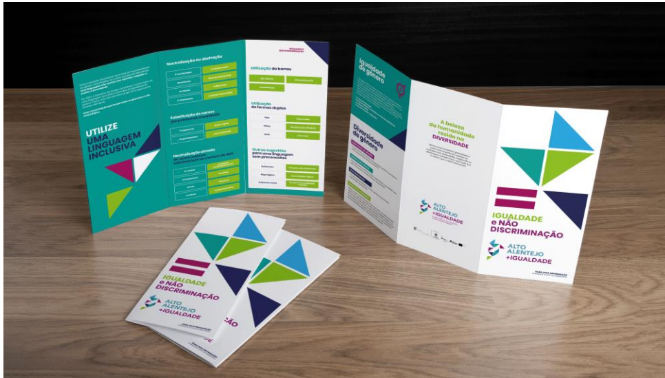
Figura 3 – Flyer sobre a temática da igualdade e da não discriminação