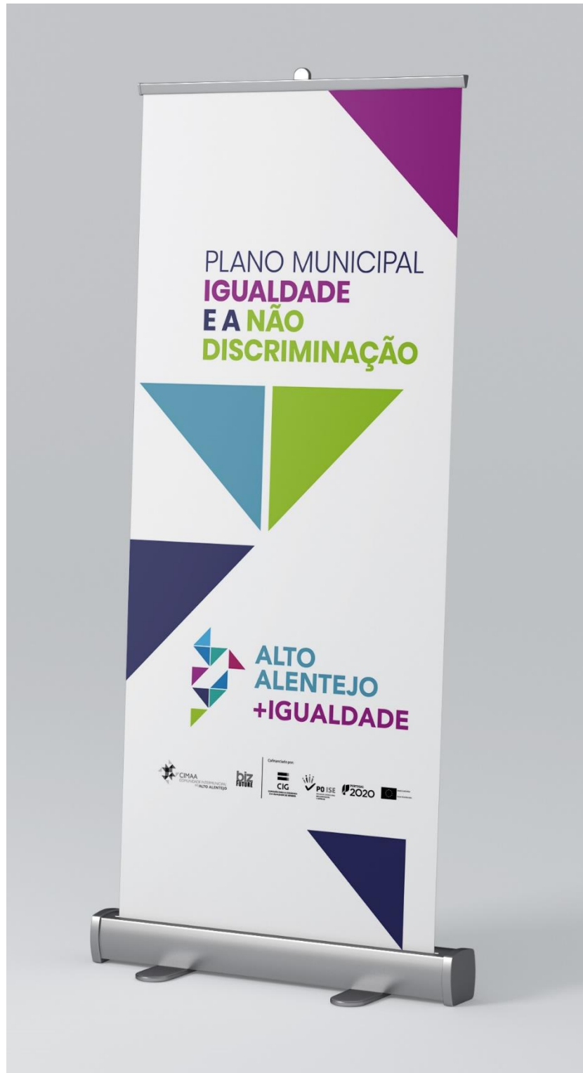
Figura 5 – Roll up de divulgação do PMIND