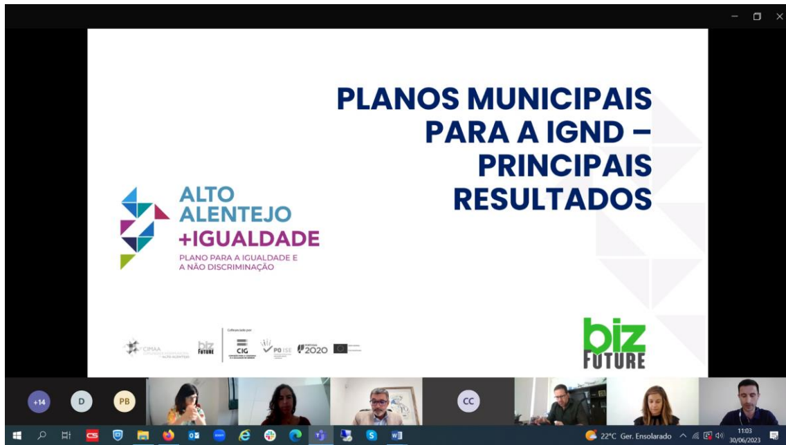
Figura 6 - Evidências do Seminário Alto Alentejo + Igualdade